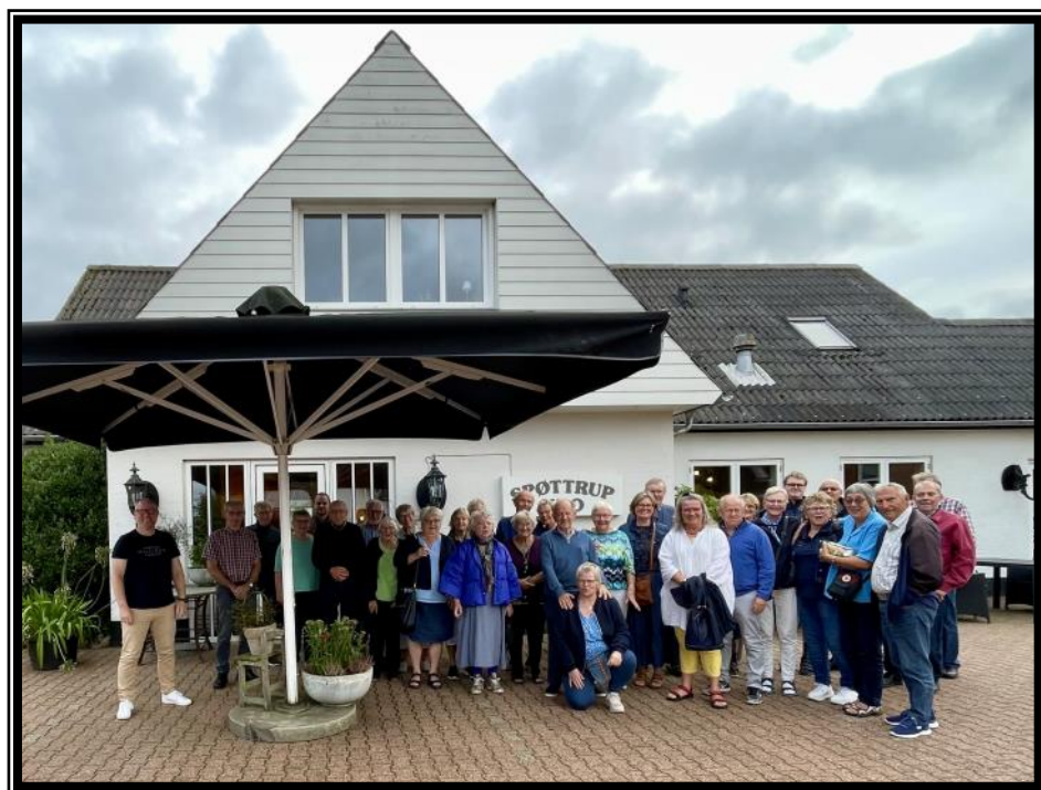
Glansbillede fra Løvfaldsturen