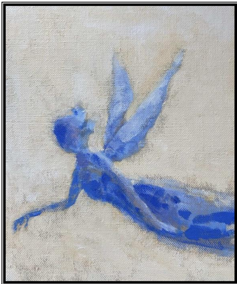
Engel - akryl på hør 2025 af Nikolaj Lolk